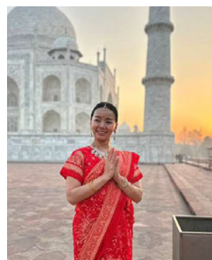
RIE先生(ツアー同行・ヨガ指導)

本旅行はインスタイル株式会社の旅行企画を基に、 株式会社スカイエフワールドが旅行手配・販売するものです