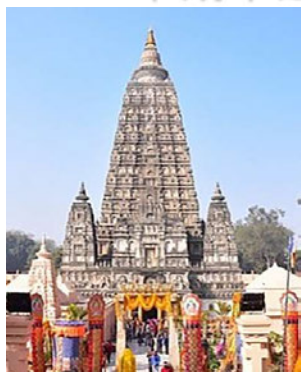
ブッタガヤ マハーボディ寺院