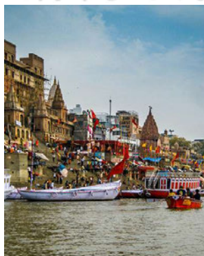
バラナシ 聖なる川ガンジス