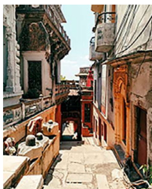
迷路のような旧市街