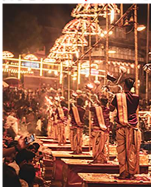
祈りの儀式ガンガーアールティ