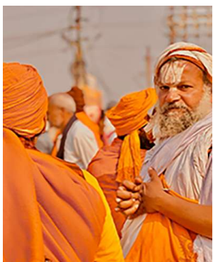
世界中から集う巡礼者達